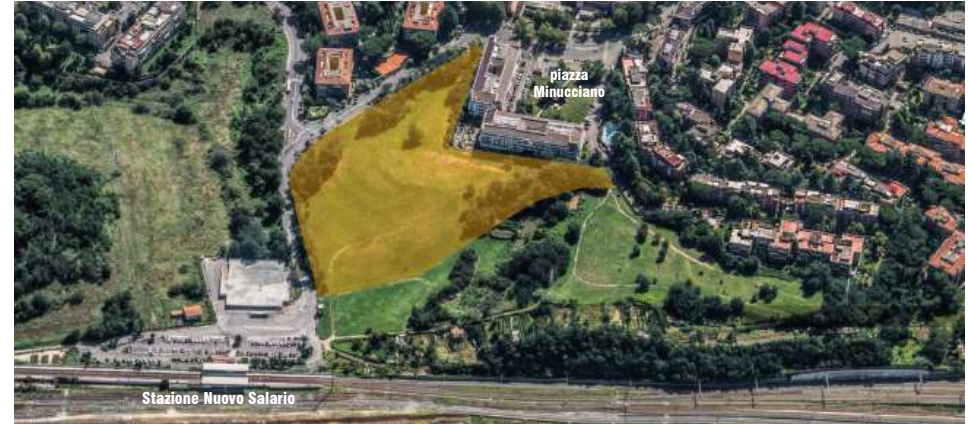
[Area di progetto / Bing Maps, 2019]