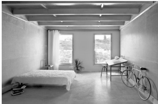
[Lundgaard & Tranberg Arkitekter, 2006]