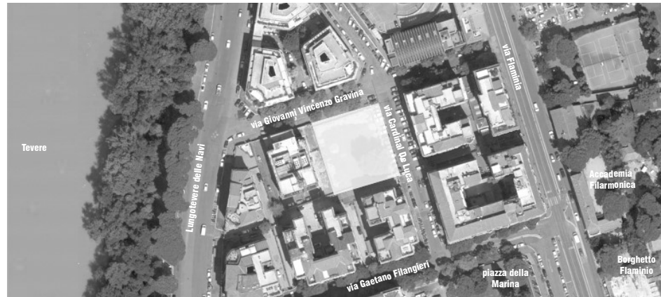
[Area di progetto / Bing Maps, 2021]

• Residenze per studenti • cucine "al piano" o mensa comune • spazi per lo studio (sala lettura, medioteca) • spazi per attività fisica (palestra, gioco) • spazi aperti anche alla città: bar caffetteria con spazio esterno di pertinenza, emeroteca e area web, playground • atrio (o atrii) di ingresso alle residenze per studenti • portineria • caffetteria • servizi igienici • parcheggio biciclette con eventuale ciclo officina • lavanderia • spazio per armadietti • saletta proiezioni • postazioni internet • magazzino • spazi multifunzione o specificatamente liberi da funzione. Questo elenco è solamente una traccia delle possibili attività insediabili, di cui alcune sono facoltative. Ogni studente può anche immaginare e proporre spazi che non sono stati suggeriti dalla docenza. Le funzioni previste saranno stabilite nel dettaglio in relazione alle singole proposte progettuali. Le differenti ipotesi insediative e architettoniche renderanno infatti necessaria la presenza di determinati spazi piuttosto che altri. Le Residenze potranno seguire una tipologia "ad albergo", "a minialloggi", "a nuclei integrati", "mista". Gli spazi comuni rivestiranno particolare importanza. Si ipotizza di realizzare una SUL (Superficie Utile Lorda) di 2100 mq. con una tolleranza del 20%.