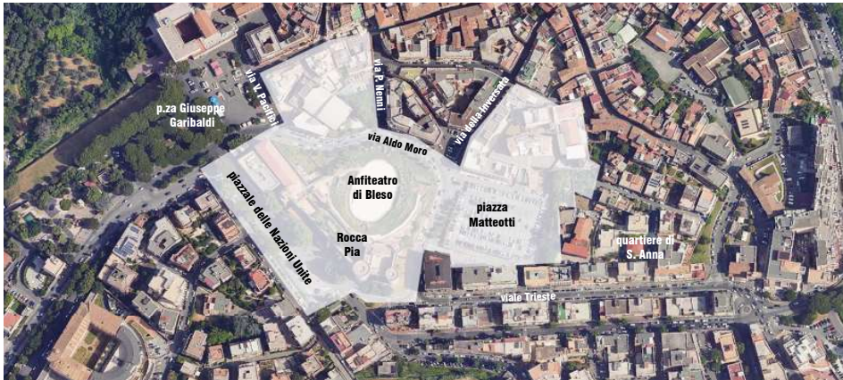
[Area di progetto - masterplan di gruppo / Google earth, 2024]